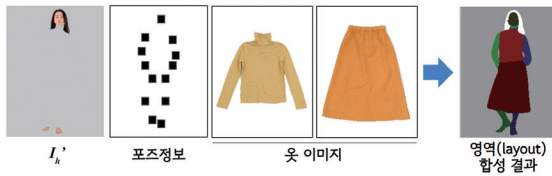
그림 5 입력 모델의 자세 정보와 옷 정보를 활용하여 영역을 합성하는 과정