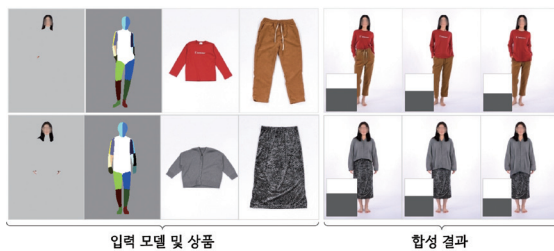
출처 Reprinted from [20].

하지만, 착용 이미지 합성은 사실적인 이미지를 합성하는 것이 유일 목표가 아니기 때문에 단순히 이미지에서 표현되는 특징들을 분석하여 추산한 수치만으로 그 성능을 정확하게 평가할 수 없다. 예를 들어, 합성된 모델이 이미지만 보았을 때 매우 사실적이라고 하더라도 입력된 옷을 잘 반영하지 못했다면 착용 이미지 합성은 실패한 것으로 간주되어야 한다. 이러한 특징을 반영하기 위하여 가상 착용 이미지 합성 분야의 연구에서는 사용자 선호도 평가를 수행한다. 보다 자세하게는 A신경망과 B신경망이 같은 패션모델 및 상품 입력으로 합성한 이미지를 피험자에게 제공하고 어느 이미지가 더 이미지 합성을 잘 수행했는지를 질문하고 그 결과를 취합하여 평가한다. 보다 자세하게는 합성된 이미지의 사실감(Realism)과 입력한 옷과의 연관성(Coherence)을 별도의 질문으로 구성하여 두 가지 관점에서 평가를 수행한 연구들도 존재한다[8,19]. 한편, WG-VITON에서는 상·하의 상품을 활용할 때는 상의, 하의, 모델을 잘 반영했는지를 복합적으로 평가하여 선호도가 취합되어야 하므로 단순한 선호도 조사가 아닌, 각 이미지에 대해서 1~5점 사이의