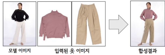
그림 1 가상 착용 이미지 합성 기술의 개요

그 중, 이미지 기반 가상 착용 이미지 합성(Virtual-try On) 기술은 그림 1에서처럼 임의의 상품 이미지와 임의의 모델 이미지를 입력으로 하여 학습된 신경망이 해당 모델이 해당 상품을 착용한 것과 같은 이미지를 사실적으로 합성해 내는 기술을 의미한다. 이 기술은 앞서 언급된 상업용 패션 이미지를 촬영하는데 요구되는 막대한 비용을 최소화할 수 있다. 본고에서는 가상 착용 이미지 합성 기술의 연구개발 동향을 소개한다. 연구개발의 가장 기본이 되는 공개 데이터셋을 정리하여 각 데이터셋가 가지는 장단점을 소개한다. 이어 데이터셋들을