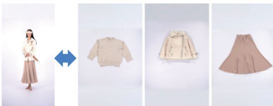
그림 2 하나의 패션모델에 다수의 상품이 대응되어 있는 Fashion-HD

기존의 Zalando 데이터세트가 256×192 해상도에 국한되어 있다는 단점을 개선하기 위해 1024×768 이미지 해상도를 가지는 이미지 13,679쌍을 포함하는 Zalando-HD 데이터세트가 한국과학기술원이 발표한 논문에서 공개되었다[5]. 해상도 외 데이터세트 구성은 유사하며 패션모델에 대한 보다 자