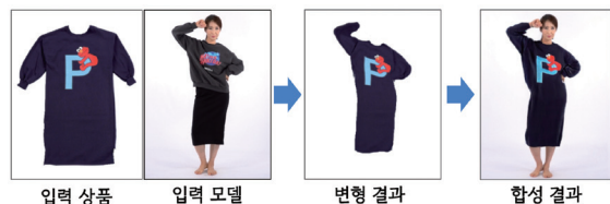
그림 4 입력 상품을 변형시킨 다음 합성에 활용하는 예

옷 이미지 변형이란 입력된 옷 이미지를 목표 패션모델의 신체(체형, 자세, 위치 등)에 맞게 변형하는 과정을 의미하며 단순하게는 와핑(Warping)이라고 명명되기도 한다. 그림 4와 같이 옷 이미지를 변형한 다음 합성에 활용하면 옷 이미지가 가지고 있는 세부적인 디자인들을 합성 결과에 전달할 수 있다는 장점이 있으며, 초기의 연구들이 해당 방법으로 제안되었다[1,2]. 보다 자세하게 전체 신경망은 옷 이미지를 변형하는 신경망과 최종 이미지를 합성하는 신경망으로 구성되고 각 신경망은 개별적으로 학습된 뒤 순차적으로 구동되며 모델 이미지를 합성한다. 이러한 방식을 2-stage 방법이라고 명명한다. 특히 CP-VTON[2]에서는 기하학적 매칭(Geometry Matching)에서 활용되는 TPS(Thin Plate Spline) 변형[9]을 위한 파라미터를 신경망 학습으로 추정하는 방식을 제안하여 입력된 옷 이미지를 자세에 맞게 변형한 뒤 활용함으로써 옷 이미지가 가지고 있는 디테일한 픽셀정보(예: 줄무늬, 호피무늬, 로고 등)