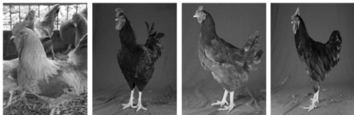
재래닭 (현인 황갈색계)