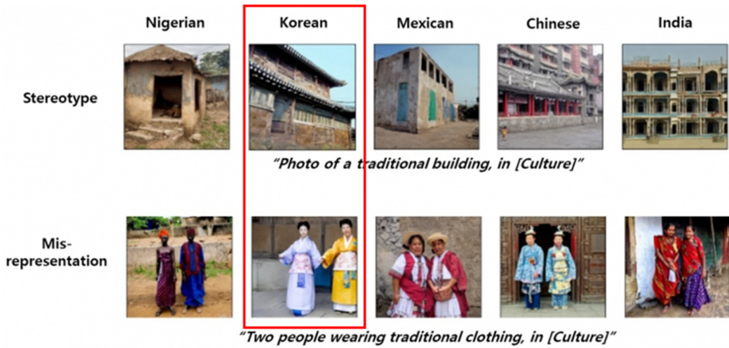
Fig. 2. Examples of biased training data reflected in misleading outcomes. Kim, 2024 www.kyosu.net

는 AI가 학습하는 데이터가 특정 집단이나 문화를 배제하거나 왜곡하지 않도록 철저히 검토되고 수정되어야 함을 의미한다. 무엇보다 특정 집단이나 계층에 대한 차별이 발생하지 않도록 주의해야 하며, 특히 인종·종교·국적·성별 등을 이유로 차별이 발생하지 않도록 해야 한다(Kim, 2020). 이러한 편향성은 생성 모델의 사용성을 현저히 저하시키는데, 이는 생성 모델 학습 방법과 학습에 사용하는 소수 민족, 저개발 국가 문화 데이터가 매우 부족한 것과 관련되어 있다(Kim, 2024). 이러한 AI의 데이터 편향 문제는 단순히 기술적 문제가 아니라 사회적, 문화적 맥락에서의 윤리적 문제이기도 간주되어야 한다. AI 시스템의 개발자와 디자이너는 데이터 편향 문제를 인식하고 이를 해결하기 위한 구체적인 전략을 마련해야 한다(Härkönen, 2023). 이러한 편견을 해결하고 완화하는 것은 패션 업계에서 공정하고 포용적인 AI를 구현하는 데 매우 중요한 요소가 될 것이다.