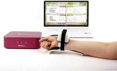
Fig. 1. 3-dimensional tonometric radial pulse analyzer(DMP-Lifeplus)

써 3차원 맥영상검사기만 표준화와 보험등재가 되었지만, 향후 한의학적 연구방법론에 입각한 연구모델로 연구개발을 진행함으로써 윤길영이 제시했던 (2) 현대생리학을 도입하여 한방생리학의 과학성을 밝히고 현대화하는 연구를 실천하고, 그 파급효과로서 (3) 한방생리학이 현대생리학의 부족한 부분을 보충해줌으로써 전체의학의 발전에 기여하는 것이 가능해질 것으로 기대된다.