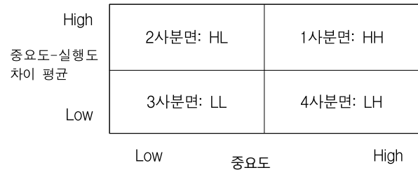
그림 4. The Locus for Focus 모형 Figure 4. The Locus for Focus Model

Focus 모형을 적용하였다. The Locus for Focus 모형은 중요도의 평균값을 X축 기준으로, 중요도와 실행도 차이(중요도-실행도)의 평균값을 Y축 기준으로 하는 그래프 상에서 각 역량의 위치를 시각화하여 표시하는 방법이다[22]. 1사분면(HH)은 중요도-실행도 차이 값과 중요도 값이 모두 평균보다 높은 영역으로 우선순위가 가장 높은 영역이다. 2사분면은 중요도-실행도 차이가 평균보다 높고 중요도 값은 평균보다 낮은 영역으로 1사분면 다음으로 우선순위가 높은 영역이다. 3사분면은 중요도-실행도 차이 값과 중요도 값이 모두 평균보다 낮은 영역으로 우선순위가 가장 낮은 영역이며, 4사분면은 중요도-실행도 차이가 평균보다 낮고 중요도 값은 평균보다 높은 영역으로 우선순위가 3사분면 다음으로 낮은 영역이다.