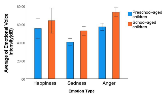
그림 2. 전학령기 아동 및 학령기 아동의 평균 강도