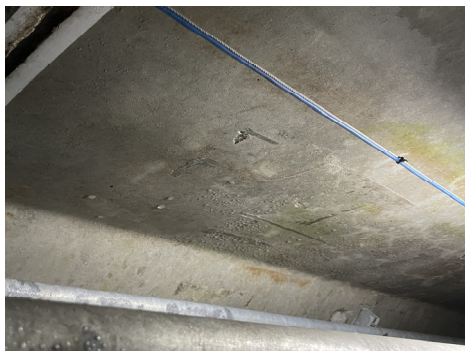
Fig. 1. Condensation inside utility tunnels

지하 공동구는 전력, 통신, 상하수도 등 다양한 인프라 시설이 밀집해 있는 중요한 공간으로, 이러한 인프라의 원활한 운영을 위해 내부 환경 관리가 매우 중요하다. 지하 공동구는 지면 아래에 위치해 있어 지하수나 비가 스며들 가능성이 높고, 외부 환경과의 차단으로 인해 환기가 제한된다. 이러한 조건들은 내부의 습도와 온도 변화를 크게 만든다. 예를 들어, Fig. 1과 같이 여름철 외부의 고온 다습한 공기가 유입되면 지하 공동구 내부의 상대적으로 낮은 온도와 만나 결로가 발생할 수 있고, 반대로 겨울철에는 내부의 습한 공기가 외부의 낮은 온도와 접촉하면서 결로를 유발할 수 있다. 이처럼 공동구 외부 환경의 변화는 결로 현상을 초래할 수 있고, 이러한 결로 현상은 금속 구조물의 부식 촉진, 전기적 장비의 오작동, 장비 수명 단축 등 다양한 문제를 일으킬 수 있다. 이러한 문제는