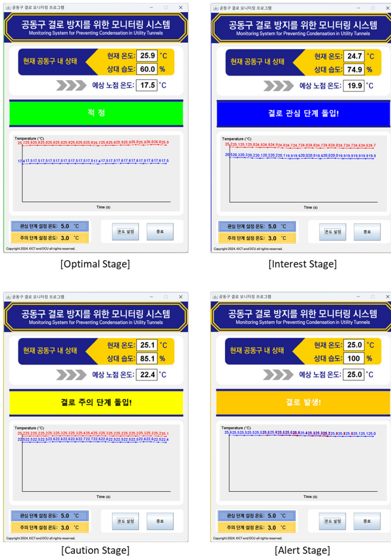
Fig. 3. Prototype system for real-time monitoring and alerting of dew formation possibility using dry-bulb temperature and relative humidity

대 습도, 예상 노점 온도를 명시적으로 나타냄으로써 관리자가 직관적으로 현재 온도의 노점 온도의 차를 통해 결로 발생이 가능한 온도차를 확인할 수 있도록 하였다. 또한, 직관적인 현재 상태에 대한 확인을 위해 각 결로 단계 색깔에 맞게 경고 메시지를 표출하도록 화면 중앙에 공간을 두었으며, 지속적으로 노점온도가 상승하며 건구온도와 격차가 줄어들음을 명시적으로 관리자가 검토할 수 있도록 하단에 최근 측정된 20개의 건구온도와 연산된 노점온도를 그래프로 출력했다. 마지막으로, 각 현장의 상황에 맞게 관심 단계와 주의 단계에 대한 온도 설정을 할 수 있도록 온도 설정 버튼을 추가하였으며, 설정된 온도 정보를 손쉽게 확인할 수 있도록 시스템 좌측 하단에 명시적으로 설정된 온도 값들을 표기하였다.