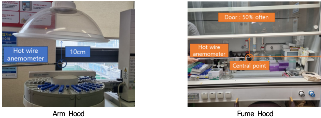
Figure 2. Measurement points using a hot wire anemometer according to hood type

점의 제어풍속 값의 차이가 크지 않다. 특히, 이번 조사에서는 흡후드의 측정 개소가 많아 시간적 제한이 있어, 흡후드의 도어(door)를 50% 개방한 뒤 개구면 정중앙 1개 지점에서의 풍속을 측정하였고, 암후드는 후드의 개구면에서 수직으로 10cm 거리에서 제어풍속을 측정하였다(Fig. 2). 또한 풍속계의 열선이 풍속의 진행 방향과 같은 방향이 되도록 하였고 풍속계의 수치가 변화가 없을 때의 값을 제어풍속으로 선택했다. 이러한 측정위치는 실제로 연구자들을 화학물질로부터 보호하고 연구자들이 사용 가능한 후드의 위치를 최대한 반영한 결과이다.