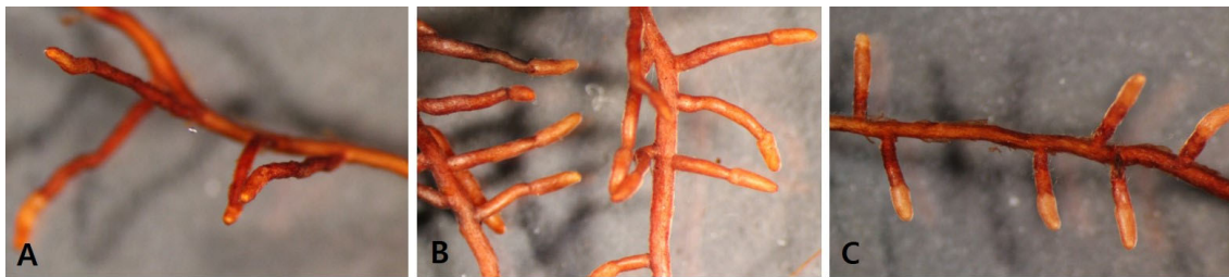
Fig. 3. Shape of roots by mycorrhizal fungus treatment; Top fresh weight (A), Control (HY8199, 2X) (B), OI: Oidiodendron maius (HY8213, 1.6X) (C), PT: Pisolithus tinctorius (HY8219, 2X).

*PT: Pisolithus tinctorius , OI: Oidiodendron maius . ; The analysis indicated that all measured variables showed significant changes over time ( p < 0.05 ) and significant interactions between time and treatment groups ( p < 0.05 ), with corrections for sphericity violations applied as necessary, ensuring the findings' statistical significance.