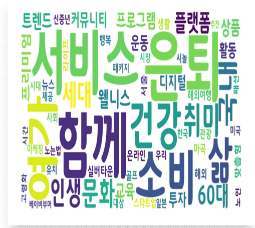
<그림 1> 액티브 시니어 여행 빈도분석 시각화 결과

액티브 시니어 여행과 관련성이 높은 단어 60개를 대상으로 빈도분석을 시행하였다. 1위로 빈출 빈도를 나타낸 단어는 '은퇴(405)'이며, 그다음으로 '함께(359)', '서비스(348)', '소비(236)'로 나타났다. 은퇴 이후의 삶을 보다 능동적으로 보내기 위하여 액티브 시니어 세대는 여행을 통해 제2의 삶을 시작하며, 부인 등 가족과 함께 다양한 관광 서비스와 소비활동을 영위하고 있기 때문에 나타난 결과로 보인다. 그다음 단어는 여가(231)', '건강(227)', '삶(219)', '취미(186)', '국내(184)', '문화(172)', '인생(163)', '세대(156)', '60대(151)', '플랫폼(147)', '웰니스(145)', '프로그램(139)', '트렌드(138)', '교육(135)', '상품(133)', '프리미엄(128)', '커뮤니티(128)', '활동(123)', '디지털(121)' 등으로 나타났다. 액티브 시니어 여행 관련 단어의 빈도분석 및 비율은 <표 1>과 같고, 시각화를 진행한 이미지는 <그림 1>에 정리하였다.