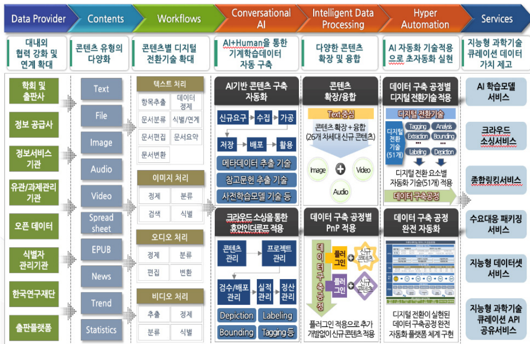
<그림 1> A기관 디지털 큐레이션 플랫폼 워크플로우

<그림 1>의 디지털 큐레이션 플랫폼의 가장 큰 특징은 논문, 보고서 중심의 학술 콘텐츠 구축 관리에서 콘텐츠 유형의 다양화와 AI 기술을 활용한 콘텐츠 구축의 자동화, 데이터 구축 공정별 플러그인 적용으로 신규 콘텐츠 적용의 유연성 확보 등을 들 수 있다. 디지털 큐레이션 플랫폼은 인간-인공지능 협업 방식의 대화형 인공지능, 데이터 확장성과 유연성을 지원하는 지능형 데이터 처리, AI로 완전 자동화가 실현