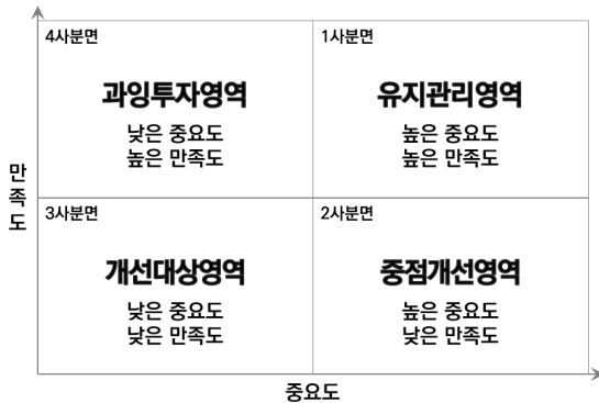
그림 1. IPA Matrix

‘유지관리영역’에 해당되어 지속적으로 유지와 관리가 필요하다고 판단된다. 중요도가 높은 반면에 만족도가 평균보다 낮은 요인들은 2사분면에 위치하며, 중요도 대비 낮은 만족도를 개선하기 위하여 집중적인 노력이 필요하기에 해당 영역을 ‘중점개선영역’이라고 한다. 만족도와 중요도의 점수가 평균보다 낮아 3사분면에 표현되는 영역을 ‘개선대상영역’이라고 하며, 타 요인 대비 시급하지 않은 요인이 주로 위치하고 있다. 마지막으로 4사분면에는 낮은 중요도 대비 만족도 점수가 높게 평가된 요인이 위치하며, 경영측면에서 효율적인 관리가 필요하다고 평가하여 ‘과잉투자영역’이라고 명명한다.