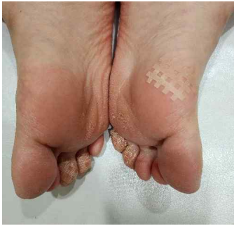
Fig 2. Calluses to essential treatment

스파이럴 테이핑은 격자 모양의 테이프로 각각 A,B,C type으로 구성되어 있으며, 방향성을 결정하여 적용해야 하고 격자테이프와 롤 테이핑을 사용하였다(Fig 3).