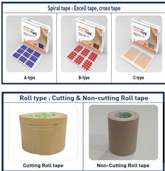
Fig 3. A,B,C excell type tape(korea) & roll type tape(japan)

스파이럴 테이핑은 격자 모양의 테이프로 각각 A,B,C type으로 구성되어 있으며, 방향성을 결정하여 적용해야 하고 격자테이프와 롤 테이핑을 사용하였다(Fig 3).