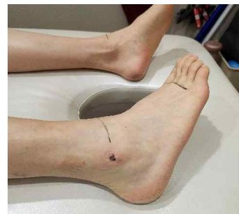
Fig 5. BL60, K17 taping