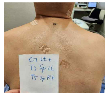
Fig 6. Cervical, thoracic block taping