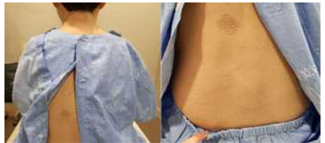
Fig 4. A, B type taping

두번째 블록 발란스 테이핑에서 4명의 대상자 모두 우회선 제한을 보여서 목뼈 4, 5번 오른쪽 방패연골과 목빗근 사이에 위치한 목갈비근, 갈비뼈 6, 7번 오른쪽 안쪽 복장갈비관절, 목뼈 5, 6번 왼쪽 척추세움근, 등뼈 7, 9번 왼쪽 척추세움근에 각각 방계대로 테이핑을 적용하였다(Fig 6).