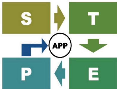
Fig. 2. Flow of STEP APP.

숙한 정보 활용 방법인 스마트폰의 APP이라는 두 단어를 사용하여, 관찰적 보행 분석을 쉽게 접근하여 문제점의 가설을 찾아가는 쉬운 추론 과정을 제안하고자 하였다(Fig. 2)(Fig. 3).