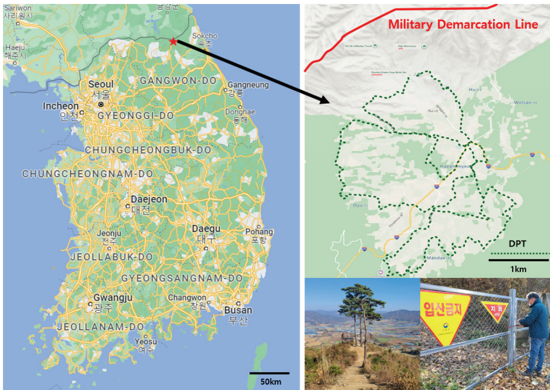
Figure 1. Research site: The DPT.

산업연관모델(Input Output Model)은 일정규모의 경제에서 생산되는 재화와 서비스의 산업간 거래관계로, 일정 기간에 생산한 재화 및 서비스의 산업간 거래를 정리한 통계체계이다(Leontief, 1936). 국가의 특정한 지역을 대상으로 하여 분석한 지역 간 산업연관모델(Inter Regional Input Output Model, IRIO 모델)은 전국 시·도를 단위로 지역 간 및 지역별 산업구조의 특성을 반영하여 투입산출표를 작성한 모델로 지역과 산업간 의존관계를 분석하는데 유용하다(Bank of Korea, 2020). IRIO 모델은 관광 및 트레일 분야에서 지역의 소규모 사이트에서 적절한 모델로 적용되고 있으나 비용과 노력이