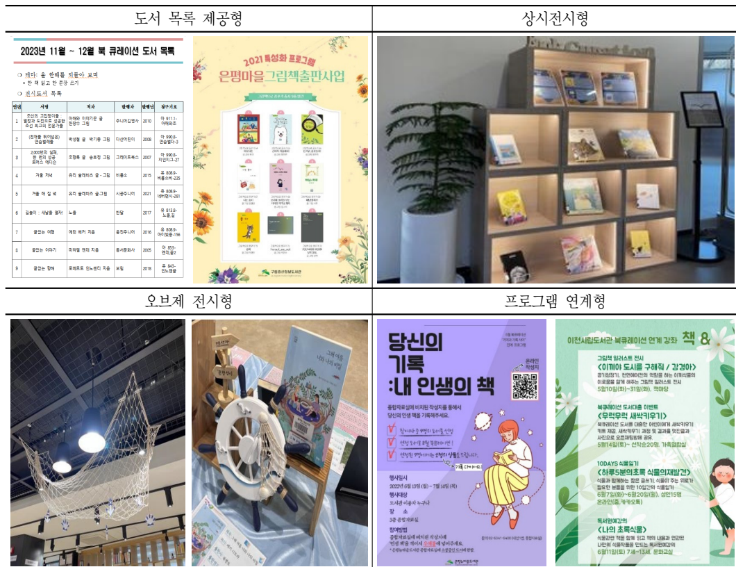
<표 1> 북큐레이션 유형 사례

도서관 북큐레이션 관련 선행연구들은 안은지(2021)에서 제시한 바와 같이 북큐레이션 개