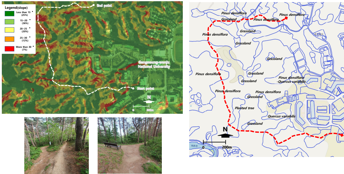
Fig. 1. Study area on Baugil in Gangneung-Si.