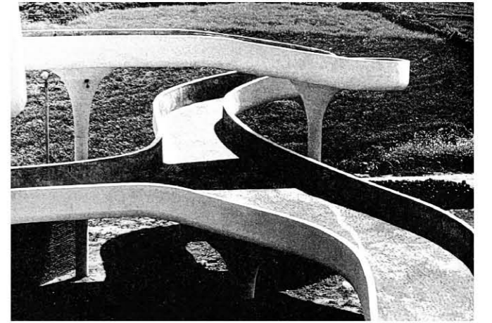
제주의 올레길을 닮은 뒤편의 경사로는 끝없이 바다로 이어져, 월츠를 추며 오르내려야 할 것 같은 자태를 지녔으며, 난간에 기대어 ‘샤를르 트레네’의 상송 ‘La mer’를 부르며 지는 해와 떠오르는 해를 바라보아야 할 것처럼 보였다. © 곽재환 건축사

결국, 해풍에 날아온 염분으로 몸이 병들고 부식돼 끝내 부서지고 사라지긴 했지만, 제주의 올레길을 닮은 뒤편의 경사로는 끝없이 바다로 이어져 월츠를 추며 오르내려야 할 것 같은 자태를 지녔으며, 난간에 기대어 ‘샤를르 트레네’의 상송