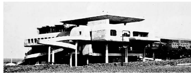
준공 당시 구 본관

다. 그러나 구 본관의 처음 계획안은 지금과 전혀 달랐다. 곡면이 없었고, 여느 건물처럼 장방향으로 정리된 안이었는데 어느 날 변경됐다. 아마도 그렇게 변한 게기가 꿈을 잃은 학생들에게 희망을 심어 주기 위해 당시 문중철 학장과 김중업 선생이 의기투합한 결과였으리라 짐작한다. 그렇게 준공된 구 본관을 보면서 학생들은 물론 제주도민 모두 자신의 눈을 의심하며 마치 꿈을 꾸는 것 같았을 것이다. 허허벌판에 느닷없이 미지의 세계로 떠나는 유람선처럼, 하늘에서 내려온 우주선처럼 나타났으니 말이다. 그것은 고난의 시기에 시대의 상처와 아픔을 극복하며 제주도민이 건축사 김중업과 함께 지어낸 한편의 동화였다. 땅과 정성으로 함께 꽃피운 한 떨기 연꽃이며 수선화 같은 존재였다. 그래서 제주대 구 본관은 제주도민에게 잊을 수 없는 건축이요, 잊어서 안 될 건축이 됐다. 하여 구 본관의 존재 의미는 단지 제주대 구 본관에 머무는 것이 아니라라고 생각한다.