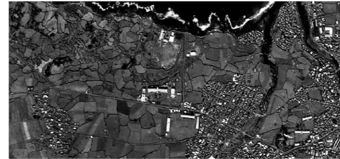
구 본관 준공 당시 항공 사진

세계로 건너온 듯, 환시를 불러일으켰다. 건축 도면은 한편의 낭만적인 월광곡을 연주하는 듯 나를 사로잡았으며, 마치 수많은 선이 서로 어우러져 감미로운 춤을 추는 듯했다. 하지만 안타깝게도 1993년 구 본관을 보존 운동 차 방문했던 것이 마지막 조우가 됐다.