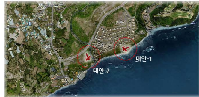
예래주거단지 내 2가지 배치 대안

우선 주민들로부터 찬성 서면 동의를 받았다. 그리고 제주대와 JDC 양측에 이 구상의 2가지 배치안을 메일로 보낸 바 있다. JDC 측도 철거하지 않고 8년간 방치된 사업을 이어갈 수 있으니 좋고, 제주대 역시 별관 캠퍼스가 생기는 것이니