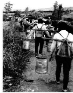
1960년대 제주 © 곽재환

건축사 김중업과 제주대학교의 인연이 시작된 것은 재정난으로 폐교 위기에 몰렸던 독립 제주대가 1962년 국립대학으로 승격되어 기사회생 되면서부터였다. 김중업 선생은 1963년 서귀포로 이전한 제주대 이농학부를 먼저 설계했고, 연이어 1964년 용담 캠퍼스 제주대 구 본관을 설계했다. 당시 제주도는 4.3사건이 마무리된 지 10년이 지나 걸론 사회 불안이 진정됐지만, 그 사건으로 인한 희생자가 6만여 명이