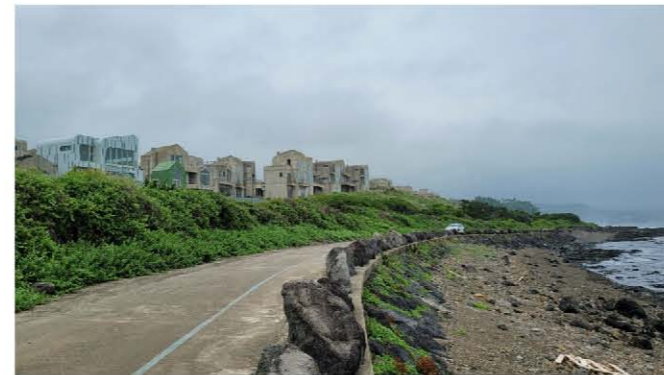
공사 중단된 예래 주거 단지

8년간 공사가 중단된 예래 주거 단지는 공공성을 위한 교육 장소로 보존해 JDC에서 산토리니처럼 문화 예술 관광단지로 개발하고, 이 지역의 공익성 확보는 제주대 구 본관을 이곳에 유치해 제주도 문화 예술센터로 활용하자는 구상이 떠올랐기 때문이다.