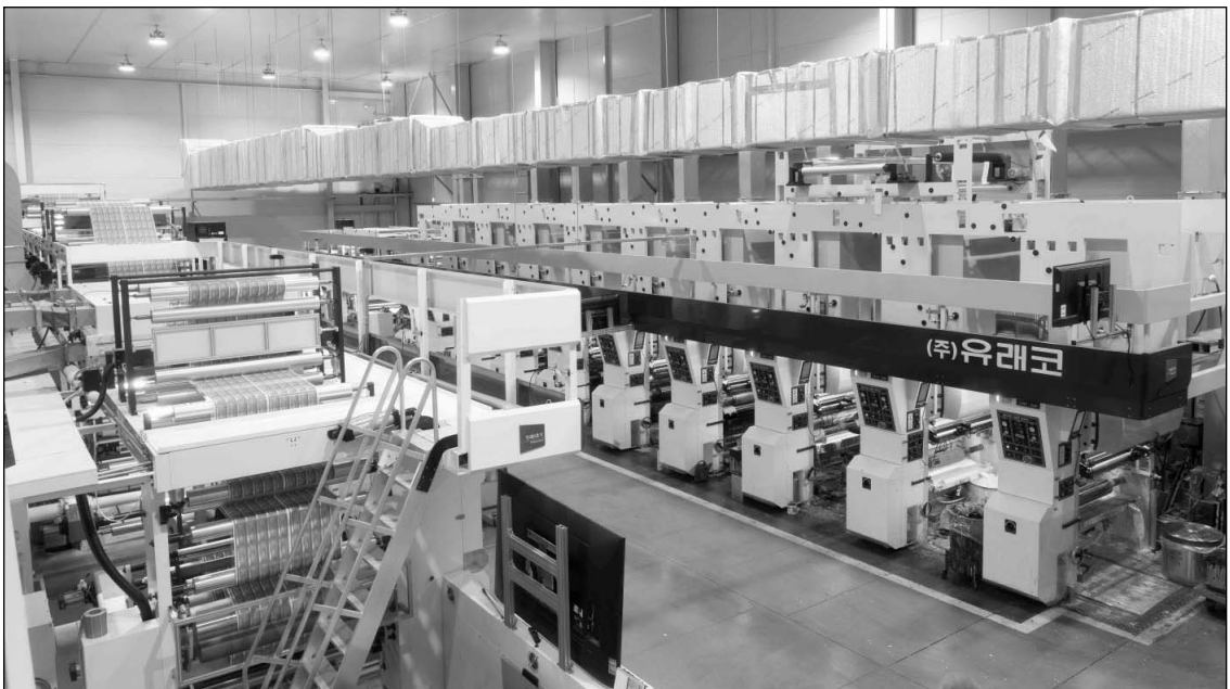
▲ 화성 공장 내부