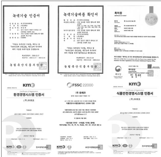
▲ 각종 환경 및 식품안전 관련 인증서 (사진 왼쪽 상단부터 시계방향으로 녹색기술인증서, 녹색기술제품 확인서, 특허증, KMR 식품안전경영시스템 인증서, FSSC 22000, KMR 환경경영시스템 인증서)

에서 순수 계열사 없이 고가의 플렉소 인쇄기를 도입함으로써 업계에 신선한 바람을 불러일으키고 있다.