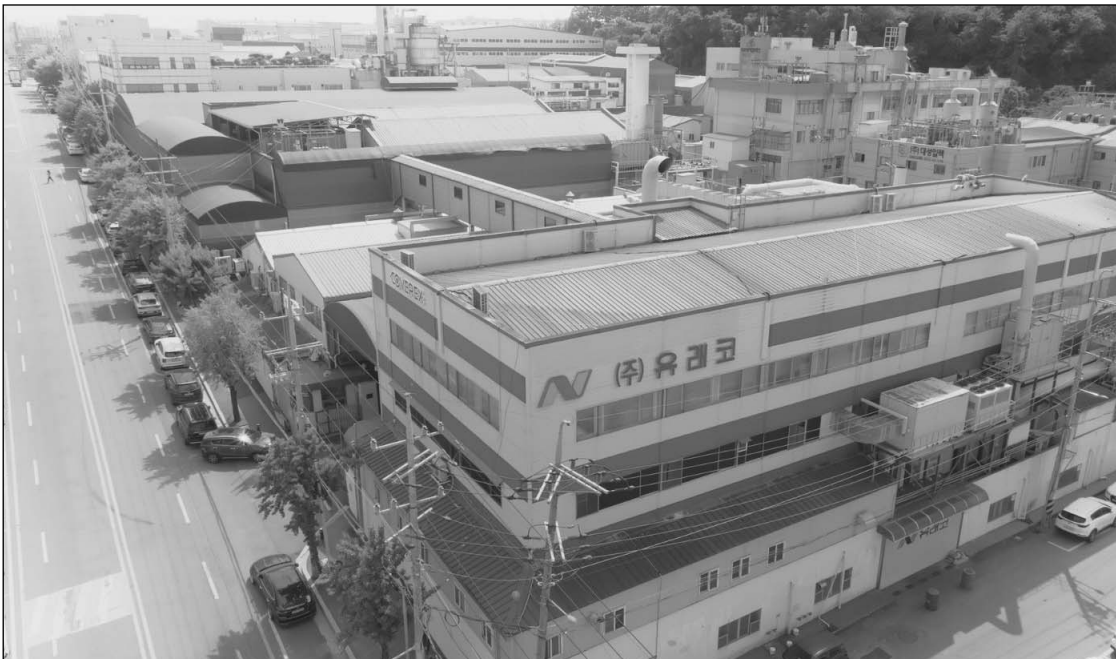
▲ 유래코 회사 전경

유래코의 시작은 우유 뚜껑에서부터 비롯됐다. 1960년대 우유를 병에다 넣어 소비할 당시 뚜껑의 재료는 비닐이 아닌 종이였다. 마개 역할을 하는 지전(紙錢)으로 뚜껑을 씌웠는데 일본에서는 열수축필름이 최초로 나와 마개에 덧씌