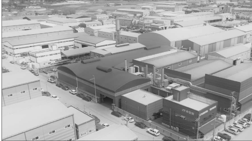
▲ HSM 회사 외부 전경

를 실시하는 등 직원들에게 더 많은 기회를 주는 문화를 형성하고 있으며, 매년 1회 임직원들을 위한 해외 워크숍도 진행하고 있다"고 설명했다.