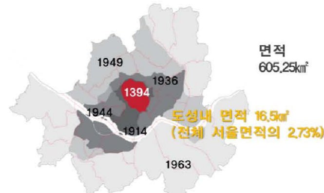
<그림 5> 서울 영역의 변화