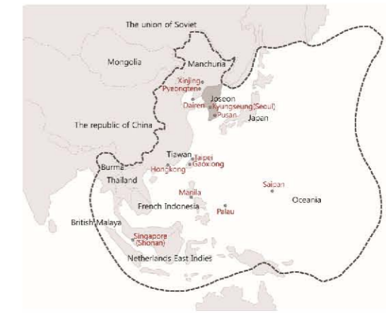
<그림 3> 20세기 초 일본 제국주의 영역 © 일본제국주의, 식민지 도시를 건설하다. 하사야 히로시 지음 김재정 옮김, 모티브, 2004