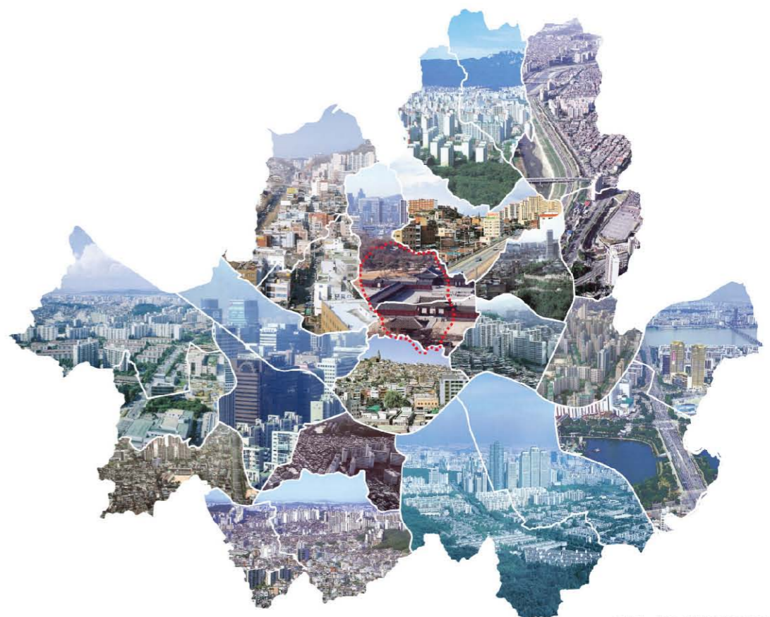
<그림 7> 서울 25개구의 집합체