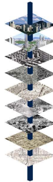
<그림 6> 도시정체성 형성