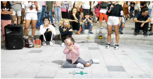
꼬마 가시나 통장7살 장소연 선미 - 가시나 cover dance 다이아니Diana 등록자 64.4만명