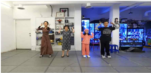
최정 다시보기 표시