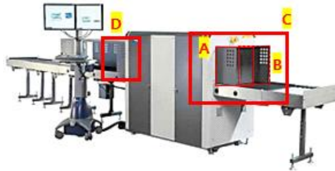
Figure 3. X-ray Screening System

반면, 엑스선검색장비의 출입구(C, D)를 제외한 몸체 부분에서의 표면방사선량률 측정은 다음과 같은 절차를 따른다. 검색장비의 몸체는 보안요원 및 승객의 동선과 밀접하다. 따라서, 검색장비를 운용하면서 시료를 연속 투입하고, C와 D를 제외한 양 옆면과 윗면의 표면에서 0~5 cm 위치에서 10분 이상 방사선을 측정한다. 이때, 10분 동안의 측정값의 평균이 이하로 나타나야 한다.