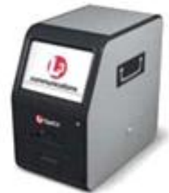
Figure 4. Explosive Trace Detector

표면방사선량률 측정은 특정 절차에 따라 진행된다. 운용 중인 장비에서는 바닥을 제외한 장비의 5면 각각에서 표면 0~10 cm 위치에서 10분 동안 방사선을 측정한다. 이때, 사용되는 측정 장비를 통해 얻어진 10분간의 측정값의 평균이 표면방사선량률 기준인 5 \mu\text{Sv/h} 이하로 계속되면 평가를 종료한다.