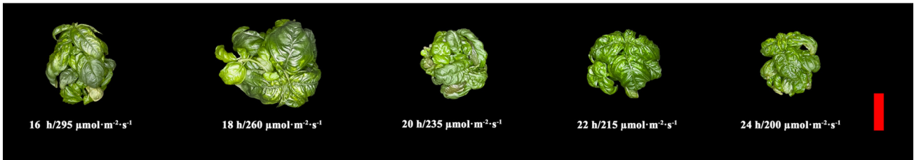
Fig. 1. Basil ( Ocimum basilicum L.) grown under different photoperiod and light intensity treatments (16h-295, 18h-260, 20h-235, 22h-215, 24h-200 μmol·m -2 ·s -1 ) in same DLI for 4 weeks after transplanting. Red line indicates 7 cm in length.

NS,*** Nonsignificant or significant at p \leq 0.001 , respectively.