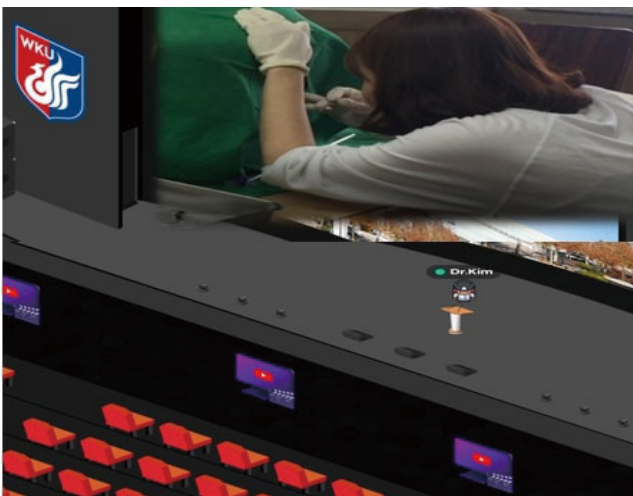
Figure 2. Clinical procedures education using metaverse platform. Spinal puncture technique demonstration.

서울대학교 의과대학은 기존 해부 실습용 인체를 활용하는 실습 교육을 대체하기 위해 선택 과목으로 ‘해부 신체 구조의 3D 영상 소프트웨어와 3D 프린팅 기술 활용 연구 및 실습’ 총 4과정을 메타버스를 통해 진행하였다. 학생들은 수술이 필요한 환자의 실제 데이터를 토대로 VR, AR, 3D 프린팅 콘텐츠를 제작하고, 체험하고, 토론에 참여하였다. 해부학 실습 교육은 경제적, 윤리적 한계를 지니고 있지만, 가상 세계를 통한 체험은 환자의 진단과 수술에 대한 경험을 경제적, 윤리적 한계 없이 자유롭게 할 수 있다. 22 분당서울대학교병원에서는 스마트 수술실을 통해 폐암 수술 교육을 시연하면서 아시아 각국의 흉부외과 의료인 200여 명이 메타버스 안에서 체험할 수 있도록 하였다. 체험자들은 메타버스 안에서 자유롭게 움직이며 전문의와 간호사의 역할까지 확인하였으며, VR 장비 없이도 참여할 수 있었다. 흉부외과에서는 전공의 교육을 위해 가상으로 진행되는 수술 교육에 메타버스를 활용하고 있다. 9