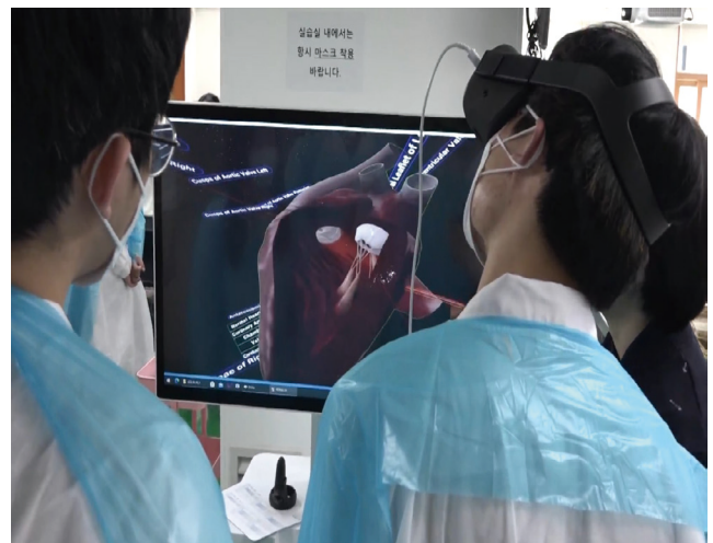
Figure 3. Medical students use a virtual-reality headset in human anatomy laboratory at Seoul National University College of Medicine.

서울대학교 의과대학은 2021년 ‘해부 신체구조의 3D 영상 소프트웨어와 3D프린팅 기술 활용 연구 및 실습’ 과목과 인체 해부학 실습에 메타버스를 도입한 실습 교육을 실시하였다. 23 해당 교육 과정에서는 의대생들이 가상 현실을 통해 인체 내부를 분석하는 해