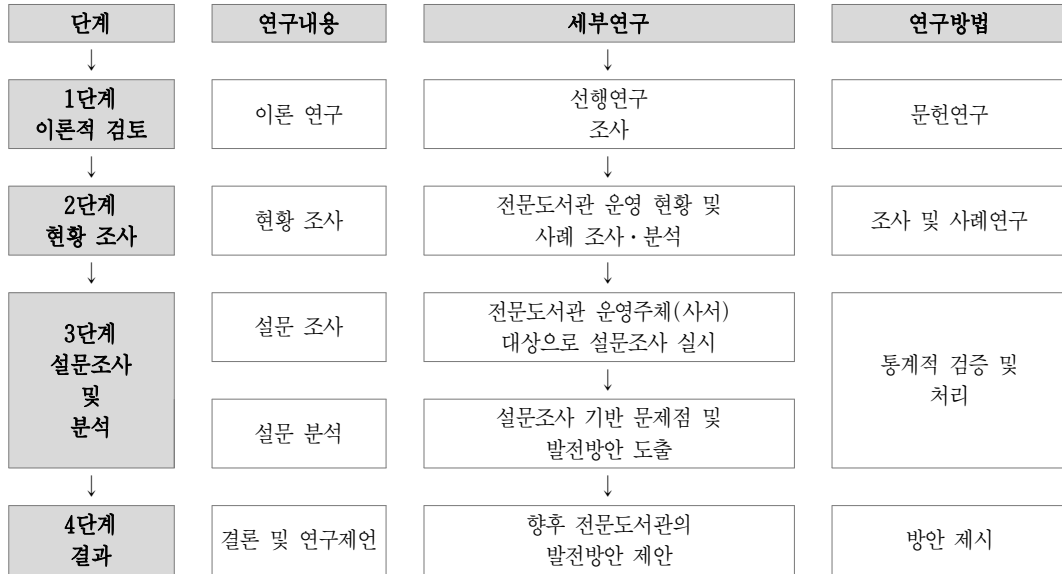
〈그림 2〉 연구 절차 및 연구방법

참고하여, 전문도서관 사서를 대상으로 전문도서관의 서비스 현황조사와 전문도서관의 기능 제고 및 전문도서관 법제마련을 위한 문항을 개발하였다. 설문지 문항구성 과정에서 1차로 개발된 설문지는 전문가 8명을 대상으로 사전테스트를 진행하였고, 이를 통해 모호한 표현이나 연구에 부적절한 항목을 수정 또는 삭제했다.