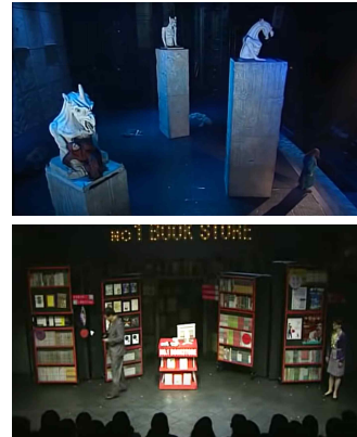
그림 2. 뮤지컬<노트르담 드 파리>의 이동형 가고일 기둥과 뮤지컬<빨래>의 이동형 무대장치 Figure 2. The moving pillars in the musical <Notre-Dame de Paris > and the movable stage sets in the musical <Laundry>

서 이동형 가고일 기둥의 형태와 뮤지컬 <빨래>에서의 공간성 창출을 위한 이동형 무대장치의 기능을 중심으로 설계하여 제작되었다.