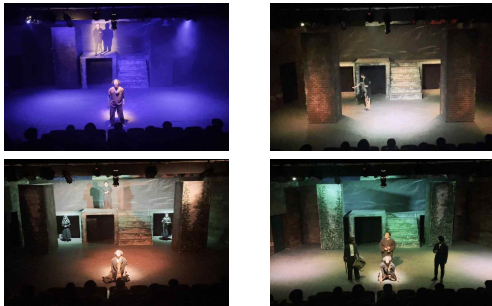
그림 4. 이동형 무대장치를 통한 공간변화 양상 Figure 4. Changing spatial configurations enabled by the movable stage set.

회화, 조소, 음악과 같은 예술 장르에서 예술가 자신을 표현하기 위한 부분에 초점을 둔다면 공연예술에서의 무대는 공연을 목적으로 하고, 관객을 필요로 하며, 관객의 이해를 돕고 극을 효과적으로 보여주는 시각적 기능을 한다[18]. 작품의 정보전달을 가장 중요로 하는 극의 초반 ‘장발장’이 가석방되어 몽트레이(Montroueil)에서 시장이자 공장장인 ‘마들렌’으로 신분이 바뀌는 8년 동안의 시간 변화와 장소의 변화는 관객에게 구체적인 정보 전달이 필요하다. 표 1에서 찾아볼 수 있는 장발장의 가석방, 지역 이동 중의 구직, 성당에서의 은춑대 도둑질과 같은 장면 연출을 위해 3D 영상을 활용, 회전 무대를 활용하는 공연 사례를 찾아볼 수 있지만, 소극장에서 극장 시설을 활용한 장면의 전환과 배경의 이해를 위해 본 연구자는 그림 4와 같이 실제 공연에서 이동형 무대장치를 활용하여 공간성을 창출하였다. 또한 ‘장발장’의 구직 과정을 이동형 무대장치를 통해 상징화하여 극의 정보를 전달하였다.