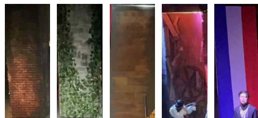
그림 3. 이동형 무대장치 4면 구성 Figure 3. Movable stage set with four sides

총 4면으로 구성된 이동형 기둥은 그림 3과 같이 각각 적색 벽돌, 흰색 벽돌을 휘감은 담쟁이덩굴, 목재로 구성된 시대적 배경의 가옥의 벽면, 바리케이드를 상징하는 바퀴와 가구들을 설치하였고, 바리케이드가 최초로 등장하는 1막의 마지막 부분까지 프랑스 국기를 천으로 제작하여 'Do you hear the people sing?' 장면에서 활용되었다. 이동형 무대장치와 무대의 조화를 위해 무대의 양옆 벽의 적색 벽돌, 나무 벽으로 제작하고, 업스테이지의 스캐프 홀딩과 계단은 백색 벽돌로 제작하였으며, 극장의 천정에는 프랑스 국기를 상징하는 천을 고정하여 이동형 기둥 장치와 이질감이 없도록 구성하였다. 이러한 무대 구성과 이동형 무대장치의 활용을 실제 공연에 적용하여 공간성 창출과 정보의 전달을 통한 줄거리의 전개, 인물의 내적 상태의 반영을 통한 상징성 부여의 기능을 확인할 수 있다.