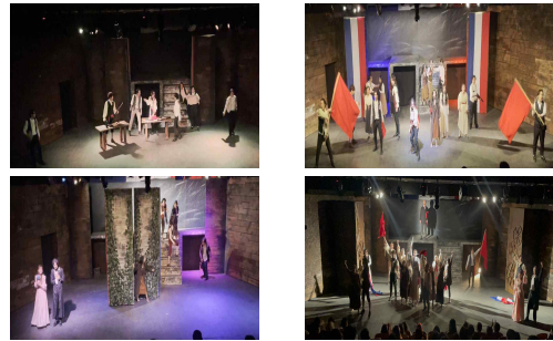
그림 5. 이동형 무대장치를 통한 정보전달 Figure 5. Information transmission through a the movable stage set.

뮤지컬 <레미제라블>에서는 ‘라마르크’ 장군의 죽음 이후 작품의 핵심적 배경이 되는 1832년 프랑스 6월 봉기를 중심으로 바리케이드에 모인 인물들의 이야기에 집중된다[15]. 1막에서 ABC 카페와 ‘장발장’의 집은 ‘마리우스’의 혁명과 사랑에 대한 갈등을 반영하여 교차 구성되어 있고, 총 6곡의 노래로 구성되며, 5번 이상의 공간 변화를 필요로 한다. 이 과정에서 조명을 통한 분위기 형성과 이동형 사각기둥을 통한 공간 연출을 통해 공간 변화를 표현하였고, 그림 5와 같이 장면에서 등장하는 배우의 물리적 연기 공간 확보를 위한 이동형 사각기둥의 공간 배치로 장면에서 필수적으로 표현되어야 하는 정보를 관객에게 효과적으로 전달하였다.