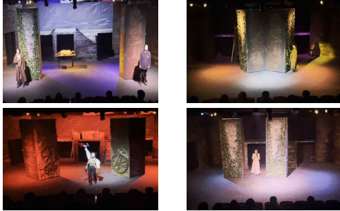
그림 6. 이동형 무대장치를 통한 인물의 내적상태 형상화 Figure 6. Visualizing the inner state of characters through the movable stage set.

감정 상태를 반영한 속도로 이동하여 인물의 내면 상태를 상징화하였다. 이러한 양상은 뮤지컬 <노트르담 드 파리>에서 가고일 기둥을 활용하여 ‘과지모도’의 내적 공간 형상화, ‘프롤로’를 압박하고 밀어내는 장면에서 활용된 사례를 통해 인물의 내적 상태의 투영을 찾아볼 수 있다[23].