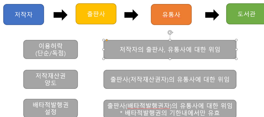
<그림 2> 도서관 전자책 서비스 라이선스의 흐름

그런데 문제는 유통사가 계약의 당사자로서 적법한 지위를 가지고 있는가를 확인하기가 실질적으로 불가능하다는 점이다. 개개의 전자책에 대해서 저작자와 출판사 사이에 체결된 계약, 출판사와 유통사의 계약, 배타적발행권의 유효기간을 모두 확인하면서 거래를 진행하는 것은 현실적으로 가능하지 않다. 설령 개개의 전자책에 대해서 이러한 사항을 확인하려고 해도, 출판사와 유통사가 해당 정보를 공개하지