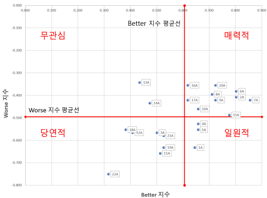
〈그림 4〉 고객만족계수에 따른 노인 서비스 품질 속성 사분면 분류

구, 학습에 필요한 인쇄 및 전자저널 소장'은 나머지 9개 항목에 비해 덜 만족한다는 의미로 해석할 수 있다. 또한 Worse 지수 중 가장 높게 나타난 항목으로 '편리한 검색도구'는 다른 9개 항목에 비해 이용자 불만을 가장 많이 감소시킬 수 있음을 예측할 수 있다. Worse 지수가 가장 낮은 항목으로는 '이용하기 편리한 도서관 위치'로 이는 해당하는 서비스를 제공했다 하더라도 다른 9개 항목에 비해 이용자 불만을 감소시키지 못함을 의미한다.