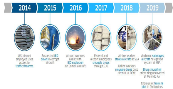
그림 2. 미국의 연도별 내부자 불법방해행위 사례 Fig. 2. Annual acts of unlawful interference by insider threat in USA

공항직원의 무기 밀매, 연방공무원과 공항직원의 공모로 인한 마약 밀수, 항공사 직원의 항공기 절도, 정비사의 항공기 항행시스템 파괴 등의 사례를 보여주고 있다.