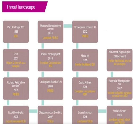
그림 1. 민간항공에 대한 불법방해행위 연혁 및 수법 Fig. 1. History and modus operandi of acts of unlawful interference in civil aviation

국제공항협회(ACI)는 2021년 온라인 세미나에서 민간항공을 공격한 항공테러의 사례 및 범행 수법에 대한 연혁을 소