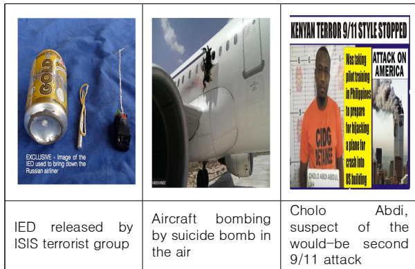
표 1. 내부자를 이용한 민간항공의 불법방해행위 사례 Table 1. Cases of Acts of Unlawful Interference of civil aviation by Insider Threat

그는 비행교육 도중 비행기 조종석에 침투하는 방법, 미국 주요 도시의 고층 빌딩에 대한 정보 검색 및 미국 비자 취득 등에 대한 정보를 연구하였다.