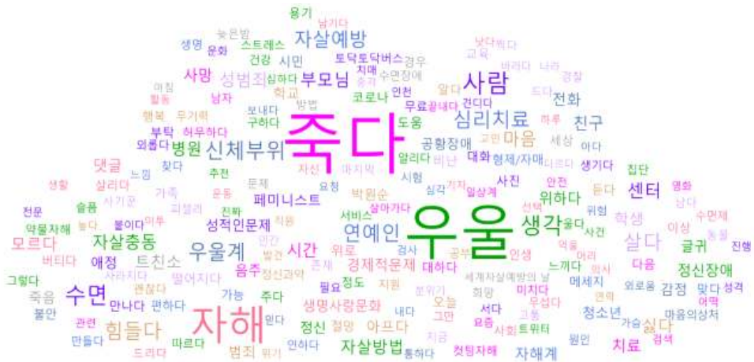
그림 4. '자살' 관련 기사물에서 등장한 상위 단어. (200개)