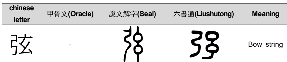
Table 2. The Ancient Characters of 弦 9)