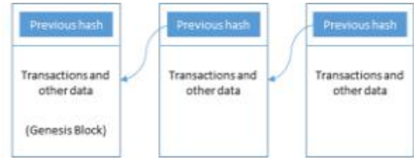
Fig. 2. The general structure of blockchain.

머클 루트는 머클 트리에 있는 모든 노드의 해시값이며, 머클 트리는 대용량 데이터 구조의 유효성을 안전하고 효율적으로 검증하는 데 널리 사용한다. 블록체인에서 머클 트리는 보통 트랜잭션을 효율적으로 검증하는 데 쓰인다. 머클 루트만 확인하면 모든 트랜잭션을 하나씩 확인하지 않고도 머클 트리에 있는 모든 트랜잭션이 올바른지 확인할 수 있다. 블록 본문은 생성된 트랜잭션들을 포함하고 있다.