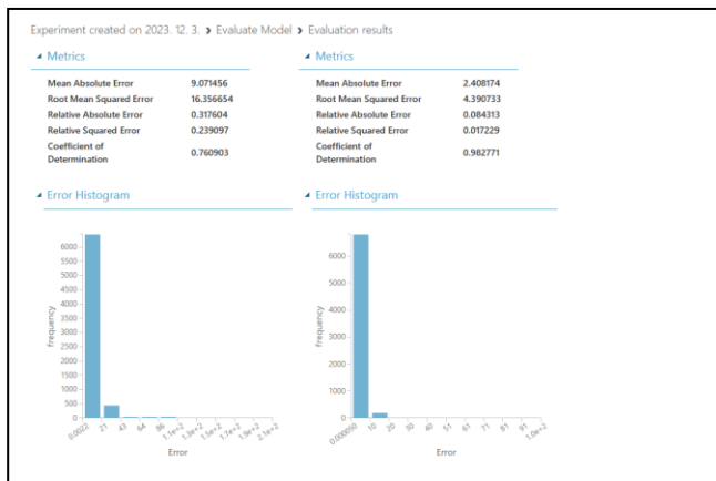
Figure 3: Poisson Regression & Boosted Decision Tree Regression

이어서 선형 회귀 모델에서는 평균절대오차 가 2.773949, 상대평균제곱오차가 5.807964 로 측정되었다. 상대절대오차와 상대제곱오차는 각각 0.09712 및 0.030146 이며, 결정계수는 0.969854 로 나타났다. 두 모델 간의 성능을 비교할 때, 신경망 회귀 모델이 선형 회귀 모델보다 상대적으로 높은 결정계수 및 낮은 에러 지표를 보여 우수한 예측 능력을 나타내고 있다. [그림 3]에선 푸아송 회귀와 부스티드 의사결정 회귀나무로 학습된 예측 모델을 검증데이터로 비교하여 시각화 했다.