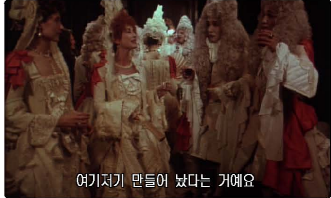
여기저기 만들어 냈다는 거예요

17세기 후반 영국의 상류층은 그들의 영지와 매우 관련이 있습니다. 실제로 대처 여사의 격려가 있기 전까지 항상 영국은 재산을 소유한다는 개념이 문명 세계에서 지위가 있다는 확실한 표시라고 믿었습니다. 이것은 재산, 돈, 유전이나 연속성에 대한 질문에 대해 걱정하고, 논쟁하고, 토론하는 귀족 그룹에 대한 이야기입니다. 그러나 풍경화가가 작업하면서 서서히 깨닫는 것은 그가 전혀 알지 못하는 것을 그리고 있다는 것입니다. 이는 살인으로 이어지는 일련의 단서입니다.