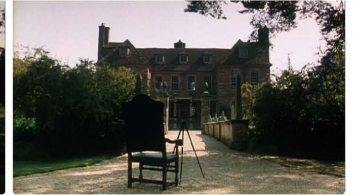
<영국식 정원 살인사건> 캡처(이하 동일)

빌 앞에 복면을 쓴 사람들이 나타나고 이들은 네빌을 실컷 능멸한 후 그를 살해해서 물에 던진다. 그의 그림들을 모두 불태우는 것으로 영화는 끝난다.