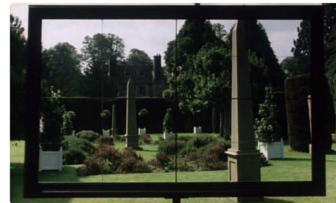
스케치 프레임(skech frame)

네빌은 약속했던 열두 장의 그림을 모두 마치고 영지를 떠났으나, 열세 번째 그림으로 허버트 백작의 시체가 발견되었던 정원의 한구석을 그리기 위해 다시 돌아온다. 그는 허버트 부인에게 화해를 청하고 그녀와 다시 정사를 가지는데, 이 자리에 나타난 탈란 부인과 그녀의 어머니 허버트 부인의 입을 통해 사실 그들이 원했던 것은 영지를 상속할 후손이었다는 실투를 듣게 된다(독일인 탈란은 생식 능력이 없는 것으로 묘사된다). 저녁 어둠 속에서 그림을 마치려고 서두르는 네