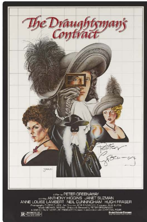
<영국식 정원 살인사건> 포스터