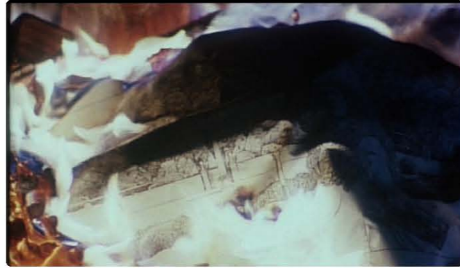
영화는 풍경 화가 네빌의 그림을 모두 불태우는 장면으로 끝이 난다