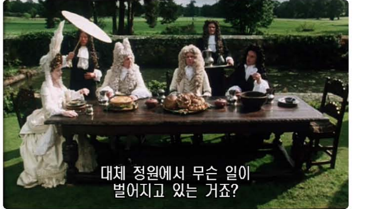
대체 정원에서 무슨 일이 벌어지고 있는 거죠?

여성에게 레이스는 매우 중요했습니다. 여성이 레이스를 더 많이 보여줄수록 자신뿐만 아니라 남편과 남편의 재산도 더 풍부해 보입니다. 이 영화에는 컬러 코딩도 있습니다. 전반부에는 귀족들이 모두 흰색 옷을 입고 있습니다. 그러나 풍경