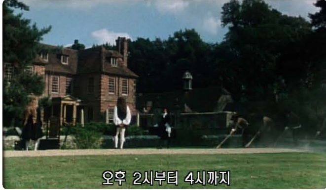
오후 2시부터 4시까지