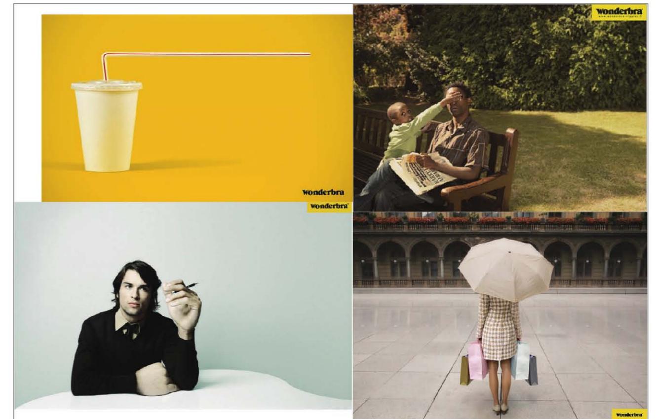
원더브라_인쇄 광고 모음

'원더브라'라는 속옷 브랜드 광고는 19금(禁) 수위를 아슬아슬하게 지키며 재미있는 상상을 자극한다. 한 장의 과장된 사진으로 원더브라를 입으면 가슴이 훨씬 더 커 보인다는 셀링포인트를 기발하게 전달하고 있는 인쇄 광고들을 살펴보자. 빨대가 길어지거나 손이 커지고 손으로 잡지 않고도 우산을 쓸 수 있는 이유는 모두 원더브라를 입었기 때문이다.