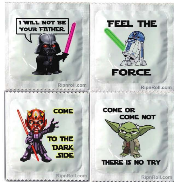
립앤롤_패키지 광고 모음

<스타워즈 에피소드 5: 제국의 역습> 편에서 주인공에게 "I Am Your Father(내가 네 아버지다)."라고 출생의 비밀을 폭로했던 다스베이더가 콘돔 패키지에 등장해서는 "I will not be your father(나는 네 아버지가 되지 않을 거야)."라고 말한다. 우주제국 최고의 전사인 요다는 영화 속 자신의 대사인 "Do or do not, there is no try(하든지 말든지 둘 중에 하나야, 그냥 '해보는' 건 없어)."를 비틀어 "Come or come not, there is no try."라는 문안을 들고 나온다. 소극적으로 해보는 것에 그치지 않고 적극적으로 하겠다는 뉘앙스를 풍긴다.