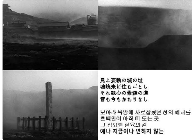
<사진 5> 영화의 시작과 끝 장면

같은 화면으로 영화가 시작되고 같은 화면으로 영화가 끝난다. 성문의 돌담(石垣), 성의 폐허(廢墟), 자욱한 안개(漂う霧). 안개가 걷히면서 기둥 하나가 클로