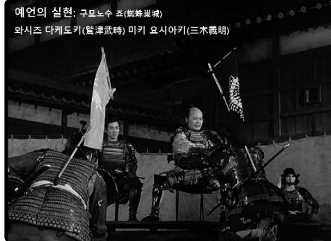
<사진 3> 모노노케의 예언에 따라 와시즈는 고쿠슈가, 미키는 제1요새의 대장이 된다.