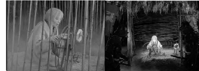
<사진 2> 모노노케 요파

용이 2022년 8월호 한국건축역사학회 기고문으로 발전한 것이다. 마침 영화모임의 일정도 우연히 일치하게 되어 동떨어진 내용보다는 일관성 있는 게 나온 것 같아 좋거나 서울 등 일부는 같은 문장을 활용한다. 이 글의 초안에는 촬영지에 대해서는 미처 서술하지 않았으나, 보충하자면 당시 후지산에 거대한 세트틀 만들어서 촬영을 했고 날씨가 좋으면 산 아래서 볼 수 있을 정도로 대규모 세트