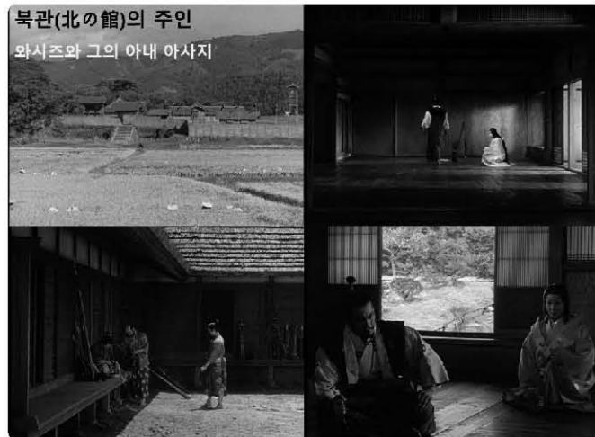
<사진 4> 북관의 내·외부 모습과, 와시즈와 그의 아내 아사지