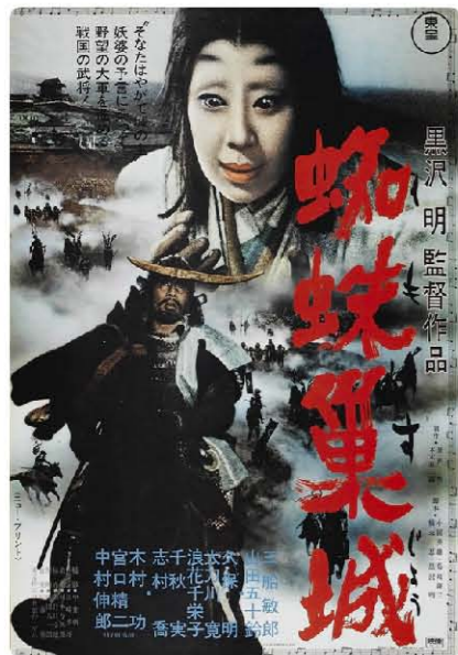
<구모노슈 죠(거미집城[거미의성])> 포스터

제작: 구로자와 아끼라, 모토기 소지로(本木莊二郎)/ 각본: 오구니 히데오(小国英雄), 하시모토 시노부(橋本忍), 기쿠시마 류우조(菊島隆三), 구로자와 아끼라/ 원작: 셰익스피어 <맥베스>/ 음악: 사토 마사루(佐藤勝)/ 미술: 무라키 요시로(村木与四郎)/ 촬영: 나카이 아사카즈(中井朝一)/주연: 미후네 도시로(三船敏郎, Mifune Toshiro, 1920 ~1997); 야마다 이쓰즈(山田五十鈴, Yamada Isuzu, 1917~2012); 시무라 다카시(志村 喬, Shimura Takashi, 1905~1982) The Throne of Blood(Film 1957 directed by Akira Kurosawa(1910~1998)/ based on Macbeth by William Shakespeare(1564~1616)/ Starring: Toshiro Mifune, Isuzu Yamada, Takashi Shimura (running time: 110m)