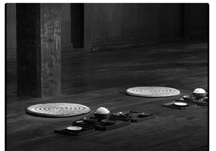
<사진 8> 도끼벌 마름의 기둥

이 우타이(謡)의 내용은 헤이안시대(平安時代 794-1192년)의 무장(武將) 사카노우에노 타무라마로(坂上田村麻呂 758~811, [後시테])가 여행하는 승려(와키)앞에 나타나서 천수관음보살의 불력(佛力)의 덕으로 일찍이 자신이 스즈카 산(鈴鹿 山中)에서 귀신을 퇴치한 것을 이야기하는 것이다. 대군(大君)을 배신한 역신(逆臣)과 그를 섬긴 귀신(鬼神)은 그래서 근절되었다(멸망했다)는 이야기인데, 와시즈 부부는 자신들이 한 행동이 있어서 이 우타이가 귀에 고통스러운 음악으로 들리는 것이다. 이렇듯 구로자와는 연희에 삽입된 우타이의 이야기까지도 영상과 밀접한 관계를 갖게끔 했다.