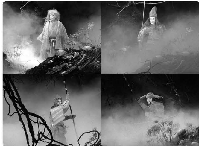
<사진 9> 사무라이 셋의 환영을 통한 초자연적인 세계 표현