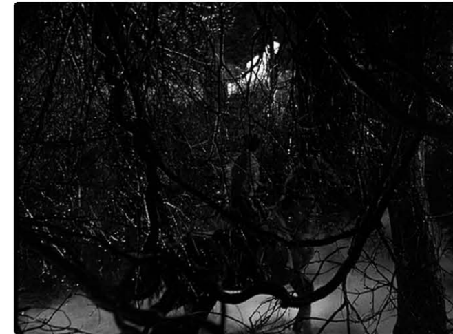
<사진 1> 거미줄 숲, 영화 <구모노슈 죠> 캡처(이하 동일)

올해 4월호부터 12편의 영화를 선정하여 연재를 시작했는데 이로써 반이 되었다. 박사 학위과정 중이던 과거를 돌이켜 보니, 꽤 오래 전인데 거의 마지막 학기로 기억한다. 학위과정 중이던 대학은 캠퍼스가 서울 및 수원에 있는데 건축학부는 수원이고 인문학부는 서울에 있다. 명륜동 캠퍼스는 사무실에서 자동차로 10분 이내에 도착할 수 있다. 어떻게 하면 시간을 절약할까 궁리하던 중, 교칙을 열심히 찾아서 고고학 등 인문캠퍼스 개설강좌를 몇 과목 수강할 수 있었다. 그 중 하나가 영문학과 박사과정에 개설된 영국 문학과 현대영화 담론 관련 과목이었다. 젊은 교수는 이 과목을 영국영화나 감상하는 과목으로 안일하게 여기고 신청한 줄로 오해하고는 학기 초부터 아예 “잘못 알고 신청한 것 아니냐?”고 하면서 쉽지 않다고 못을 박았다. 물론 사무실이 바빠서 학기말에 좋은 결과를 내지 못했지만 이 수업을 통해 얻은 게 많았다. 주제는 셰익스피어의 맥베스였고, 시대를 거둬들이면서 지속되어온 수많은 해석과 연극이나 영화 등 여러 가지 버전을 함께 논하는 수업이었다. 대부분의 젊은 학생들은 비교적 후대에 만들어진 마이클 보그다노프(Michael Bogdanov 1938~2017, 당시는 생존해 있을 때)의 현대적 재해석 등에 관심을 보였다. 내 경우 구로자와 아끼라 감독이 재해석한 ‘거미집의 성’을 일본 성곽건축에 초점을 맞춰서 중간발표를 했다. 그 이전에도 이 영화는 여러 번 보았지만 대부분 구로자와 아끼라 감독이 만든 영화의 구도 등을 중심으로 이해했을 뿐이었는데, 11세기의 잉글랜드와 스코틀랜드가 배경인 맥베스를 16세기의 일본의 전국시대 1) 로 치환했다는 것과 전통극 노우(能) 2) 의 구성을 차용했다는 데 관심을 갖고 다시 보았다. 2007년 당시 초안을 했던 네