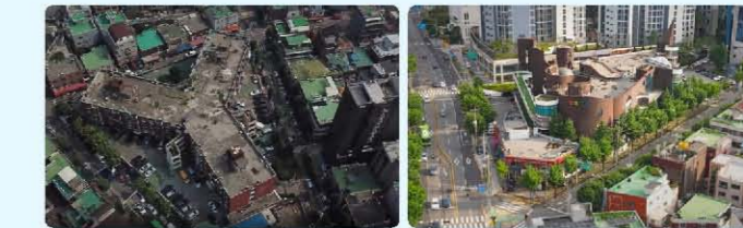
대신맨션(건축사 미상) 태양의집(김중업 작품)

다. 그러나 그냥 낡고 오래되고 경제성이 떨어진다는 이유로 해체 후 재건축을 추진하는 경우가 많다. 물론 재건축을 반대하는 것은 아니다. 다만 건축사로서 건축사적으로 가치가 있고 시대적인 의미가 있는 건축물은 사진이나 영상으로 기록할 이유가 충분하다고 본다. 아니, 꼭 기록해야 한다고 본다. 과거의 건축물도 우리 시대의 한 역사이고, 기억해야 할 건축문화인 셈이다. 처음 영상을 제작한 대신맨션의 경우 1973년에 완공된 공장, 시장, 아파트가 함께 있는 주상복합건물이다. 비록 건축사는 신원 미상이나, 그 당시에 볼 수 없었던 스킵플로어 방식의 코어, 공중브릿지, 옥상 정원, Y자형 주거평면 등 지금에도 보기 어려운 디자인을 볼 수 있다.