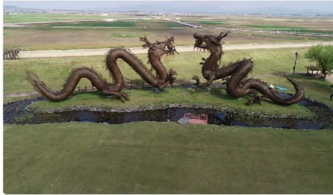
벽골제의 전설 속 쌍룡(雙龍)

는 것이다. 그게 후세에 다시 또 의문투성이의 '모아이 석상(石像)'이 될지, 아니면 산티아고 스페인의 종착지로 강한 인상을 남기고 있는 '산티아고 데 콤포스텔라 대성당'으로 남을지, 그것도 아니면 노트르담의 꼬추로 더 알려진 빅트르 위고의 소설 『노트르담 드 파리』의 무대가 된 '노트르담 대성당'으로 더 거듭날지, 그것은 알 수 없는 일이지만 말이다.