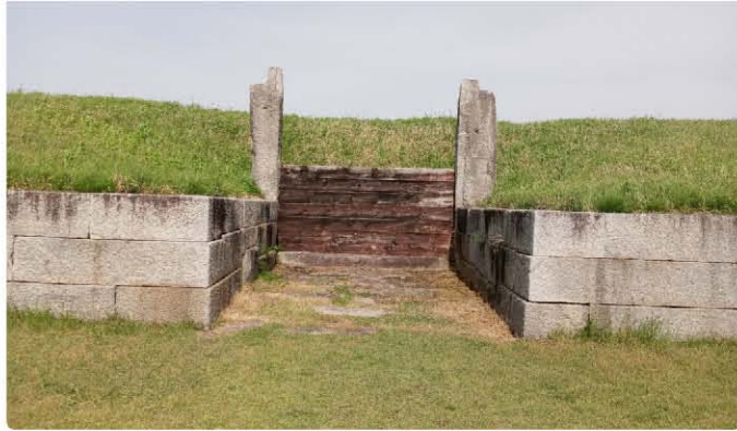
벽골제 수문 장생거

아, 그런데 우리는 4년이 아니라, 한두 세기(世紀)를 뛰어넘어 저 먼 후대까지 길이 전승될 '흔적을 남기는 작업'을 하고 있지 않던가? 저렇게 애써 남에게 구걸하려고도 하지 않은 채, 오로지 내면으로만 침잠해가며 가시적 결과물을 도출해내