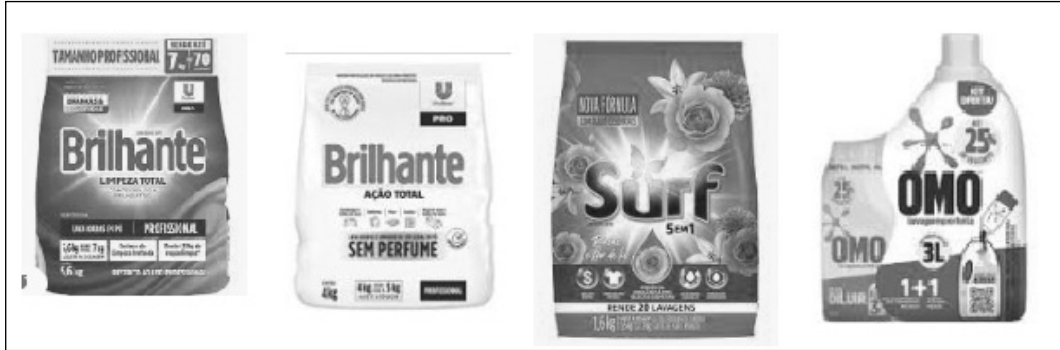
[사진 4] 세탁용 세제 포장