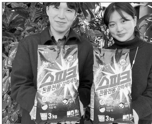
▲ SK지오센트릭이 개발·생산한 단일재질 포장재가 적용된 애경산업 ‘스파크’ 제품

이에 따라 스파크 3kg 리필제품에 사용되던 포장재는 기존 복합재질에서 SK지오센트릭이 개발 및