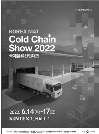
▲ 한국식품콜드체인협회(회장 서병문)는 국제물류산업대전에 'Cold Chain Show 2022(콜드체인 특별관)'을 개설하고 3월 31일까지 전시회에 참가할 업체를 모집한다.

식품 및 의약품 콜드체인 기업들의 서비스 및 솔루션 등을 홍보할 수 있는 콜드체인 특별관을 조성해 운영해왔다.