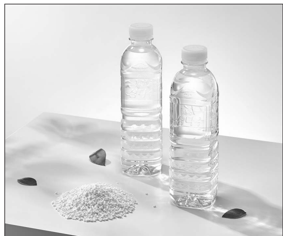
▲ SK케미칼이 식품용기시장에 ‘화학적 재활용 페트(Chemical Recycle, CR-PET)’를 본격적으로 공급한다.

우리나라 정부는 2023년부터 국내 플라스틱 제조업체에 재생원료 사용 의무를 부과하고, 페트의 경우 2030년까지 원료의 30% 이상을 재생원료로 사