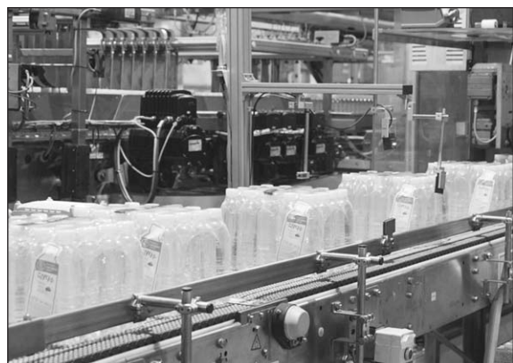
▲ 제주특별자치도개발공사(사장 김정학)가 상업용으로 적합한 화학적 재활용 페트(CR-PET)를 적용한 '제주삼다수 RE:Born(가칭)'의 생산체계를 구축해 2만여 병을 생산 완료했다.