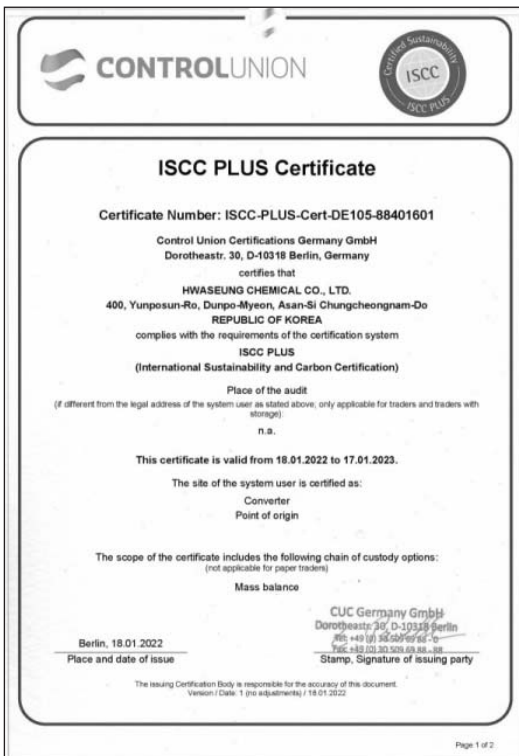
▲ 화승그룹의 정밀화학분야 대표기업인 화승케미칼(대표 우석훈)이 자사 OPP필름에 대해 국내 업계 최초로 친환경 소재 국제인증인 'ISCC 플러스(International Sustainability and Carbon Certification)'를 획득했다.

화승그룹의 정밀화학분야 대표기업인 화승케미칼(대표 우석훈)이 자사 OPP필름에 대해 국내 업계 최초로 친환경 소재 국제인증인 'ISCC 플러스(International Sustainability and Carbon Certification)'를 획득했다고 2월 10일 밝혔다.