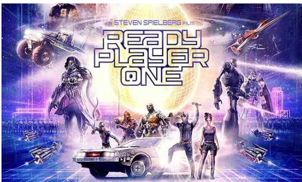
그림. 2. 영화 ‘레디 플레이어 원’ 포스터 Fig. 2. Poster for the movie ‘Ready Player One’

이번 장에서는 메타버스와 관련한 윤리적 이슈를 영화를 통해 살펴보고자 한다. 영화 썸머워즈(2009)는 주인공 오즈가 생활하는 가상세계를 소개하고, 아바타를 만들고, 메타버스 세계(사회·저차·문화 등)를 만들고, 해킹으로 인한 메타버스 세계의 혼란과 혼동으로 인한 문제점을 보여주는 메타버스 영화이다. 영화 프리 가이(2021)는 주인공 가이가 자신이 사는 세상이 현실이 아니라 가상의 게임 속이며 스스로 학습하는 인공지능(AI) 사실을 알게 되는 내용을 다룬 메타버스 영화이다. 이 외에도 아바타(2009), 13층(1999), 매트릭스(1999), 주먹왕 랄프2 ; 인터넷 속으로(2018) 등이 메타버스로 인한 윤리적 이슈들을 고려해볼 수 있는 메타버스 영화이다. 그중에서도 본 논문에서는 2018년 개봉한 영화 ‘레디 플레이어 원(Ready Player One)’은 동명의 소설