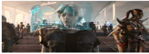
The metaverse world oasis ‘Parzival’