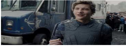
“Wade Watts” in the real world