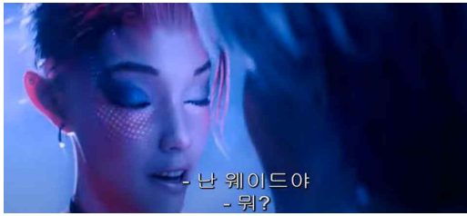
Parzival telling Samantha his real name (Wade) at Oasis