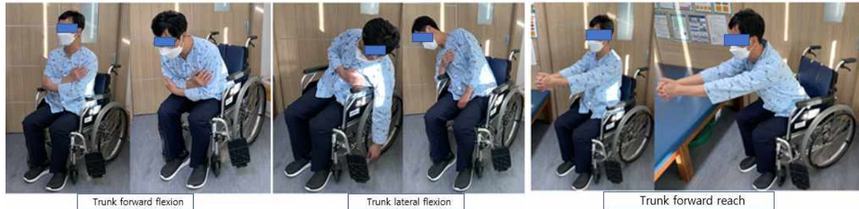
Figure 2. Trunk training in wheelchair

다. 이때 시선을 양손을 끝을 볼 수 있도록 하여 회전하는 쪽으로 자연스럽게 몸통이 회전할 수 있도록 하였다. 이 동작을 20회 반복하며, 왼쪽방향으로도 동일한 방법으로 시행하였다. 다섯째, 전방으로 몸통을 자연스럽게 숙여 휠체어 의자에서 엉덩관절이 떨어질 수 있도록 하여 반무를 자세에서 5~10초 유지후 다시 천천히 앉는 운동이다. 이때 낙상에 대비해 보호자나 치료사가 환자 앞에 위치할 수 있도록 한다. 이 동작을 10회 반복 시행하였다(Figure 2). 몸통 훈련은 1회 총 20분간 진행될 수 있도록 하였고, 주 5회 3주간 시행하였다. 훈련의 강도는 급성기 뇌졸중 환자의 신체 컨디션을 고려하기 위해 운동 자각 척도를 이용하여 13(약간 힘들다) ~ 15(힘들다)로 하였다.