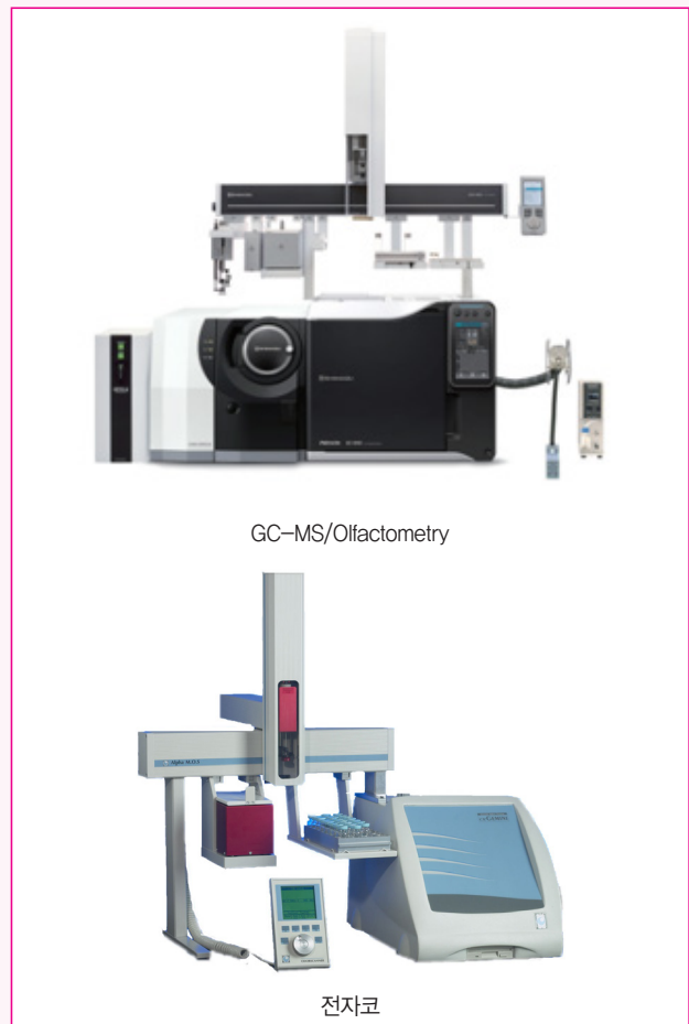
그림 1. 향미성분 분석 장치

기계적인 측정에 의한 향기성분은 보통 simultaneous distillation extraction(SDE)과 solid-phase microextraction(SPME)를 통해 추출이 이루어진 후 GC-MS를 이용하여 분석한다(Hong et al., 2021). 또한 GC-MS에 연결된 splitter를 통해 검출기와 냄새를 맡을 수 있는 탐지포트(sniff-port)로 구성된 GC-MS-Olfactometry(GC-MS/O)를 이용하여 각 휘발성 화합물(odor-active compound)의 향미의 특징(flavor note)을 확인할 수 있다. 이 외에도 비특정센서를 이용하여 향기성분을 검출하는 분석장치인 전자코 시스템은 식품의 향을 분석하는 비파괴적인 분석 방법의 하나이며,