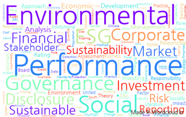
Figure 3. Word cloud analysis of ESG-related thesis key words

이상의 문헌연구를 통해 CSR과 기업성과 간의 긍정적인 연관성이 있음을 확인하였다. 문헌 및 실증방식의 선행연구를 통하여 향후 기업 들은 다음과 같은 시사점을 확인할 수 있을 것이다. 첫째, ESG 경영은 기업 이미지와 명성의 향상을 가져올 수 있으며 이는 장기적으로 회사의 경쟁력과 성과에 긍정적 영향을 미친다. 둘째 ESG 경영을 통한 장기적인 기업 이미지 개선 및 투자 확대는 내부직원의 동기 부여, 재직기간의 확대 및 채용증가로 이어질 수 있다. 이는 기업의 평판 향상이 근무환경의 인식개선으로 인한 직원의 동기 부여를 높이는 연구결과를