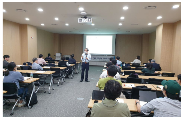
그림 2. 강의모습