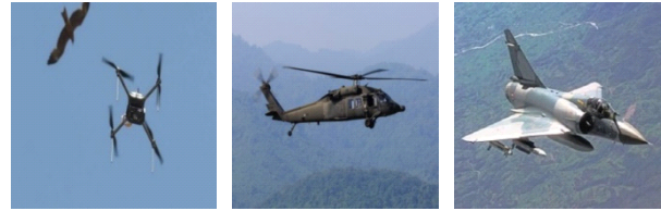
그림 1. 학습에 사용된 드론(왼쪽), 헬기(가운데), 전투기(오른쪽) 이미지 예시 Fig. 1. Examples of drone, helicopter, fighter data

본 논문에서는 그림 1과 같은 형태를 가지는 드론, 헬기, 전투기 세계의 클래스로 영상데이터를 수집하고 라벨링(labeling)을 통하여 학습을 위한 데이터를 구성하였다. 영상 데이터의 수집은 Kaggle의 공개 이미지 [3] 목록에서 드론, 헬기, 전투기에 해당하는 이미지를 검색하여 사용하였다.