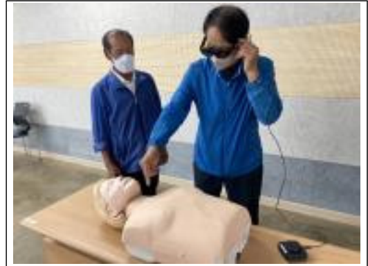
[Fig. 1.] Participants in the experiment wear Nreal Light™ and check the location of the heart by looking at the 3D human body model augmented by the mannequin.

시키고 그 위치를 확인하도록 하였다. 이 과정을 통해 3차원 인체모델을 자세히 볼 수 있으며, 마네킹과 일치시키며 심장의 위치를 확인할 수 있다.