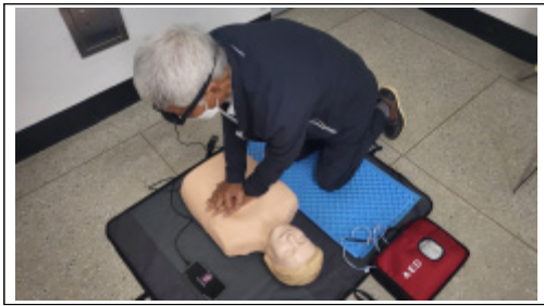
[Fig. 2.] Trainees who participated in CPR training are performing chest compression.