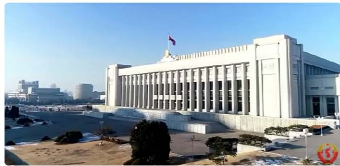
북한 만수대 의사당

북한의 법률 체제는 헌법, 법률, 시행규정, 시행세칙 등으로 구성되어 있다. 북한의 법률을 남한의 법률체계와 비교하면, 법률은 법, 시행규정은 대통령령(시행령), 시행세칙은 부령(시행규칙)에 해당한다고 볼 수 있다. 북한 법률은 인터넷으로 전문을 확인할 수 있을 정도로 공개되어 있으나, 규정, 시행세칙 등은 외국인 투자관련 외에는 거의 알려져 있지 않다.