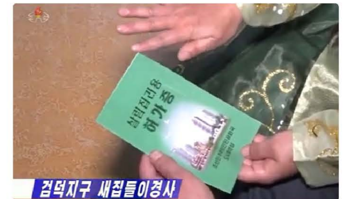
살림집 이용허가증. 살림집이 준공되면 입주 시에 인민위원장 등이 참석해 입주를 축하하는 '입사모임'을 한다.

살림집법은 살림집 건설의 절차, 준공검사, 살림집의 배정, 교환, 동거 등에 대한 규정이 있다. 그리고 살림집의 사용료 납부에 대하여 규정하고 있어 살림집의 무상공급, 무상사용에 대한 정책을 변경한 것으로 보인다. 살림집법에서는 살림집에 대한 거래를 금지하고 있으나, 살림집이용허가증을 받으면 입주할 수 있고 교환에 대한 규정도 있으므로 살림집관리기관과 결탁하여 살림집을 거래하고 있으며, 북한당국은 이를 묵인하고 있는 것으로 보인다.