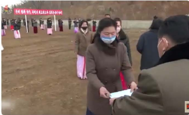
살림집 이용허가증 배포 모습. 입사무임에서 임주에 대한 측사를 하고 살림집 이용허가증을 배포한다. 도시에서는 강당 등에서 진행하지만, 농촌 등 강당이 없는 곳은 야외에서 진행한다.

살림집법과 비슷한 시기에 제정된 부동산관리법에는 토지이용 시 허가를 받도록 하고 있으며, 부동산의 가격을 정하고, 사용자가 사용료를 지불하도록 규정하고 있다. 부동산법은 불법적인 토지임대, 거래를 제한하는 목적도 있지만, 토지사용료를 지불하도록 하여 토지 이용을 제한적으로 허용하기 위한 목적이 큰 것으로 보인다. 최근 북한에서 장마당의 매대를 대상으로 받고 있는 사용료도 부동산관리법의 부동산사용료의 규정에 따른 것으로 보인다.