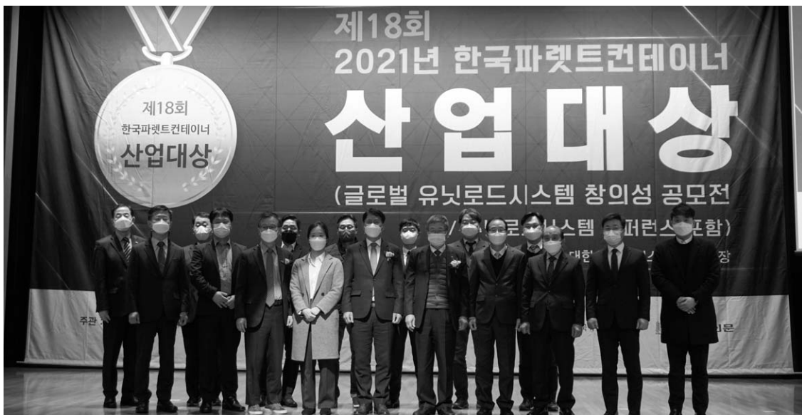
▲ (사)한국파렛트컨테이너협회는 지난 11월 10일 대한상공회의소 국제회의장에서 '제18회 한국파렛트컨테이너산업대상' 시상식을 개최했다.