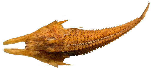
Fig. 4. Image of comparative specimen; Dorsal view of Satyrichthys rieffeli from Korea (NIBR-P 0000014510, 169.1 mm SL). SL, standard length.