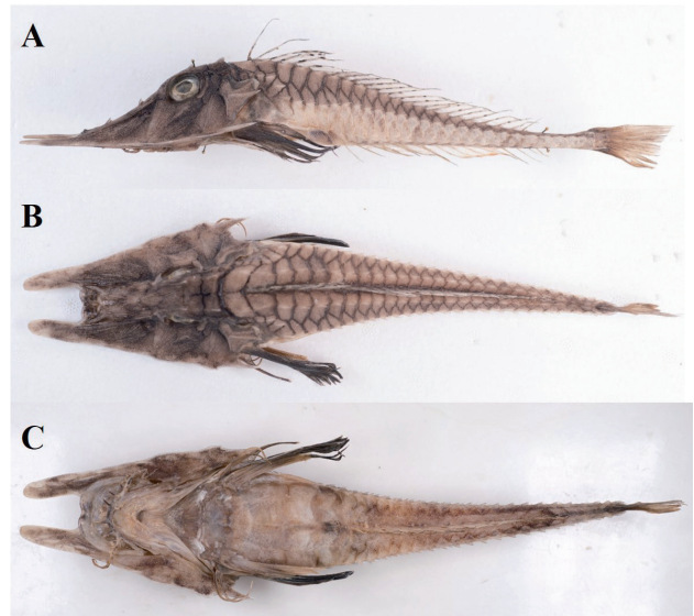
Fig. 1. Image of Satyrichthys welchi (MABIK PI00051590, 244.2 mm SL). A, Lateral; B, Dorsal; C, Ventral; SL, standard length.

계수 및 측측은 Table 1 과 같다. 몸은 원통형이며, 미병부로 갈수록 얇아지고, 몸 전체에 걸쳐 딱딱한 골판(bony plate)으로 덮여 있다. 머리는 매우 크다(체장의 35.5%). 주둥이는 짧으며(체장의 18.4%), 아래쪽을 향하고 있다. 주둥이 전방으로 길게 신장된 rostral projection이 존재한다(체장의 10.3%). 안경은 양안간격보다 약간 크며, 주둥이 등쪽 정중선에 뒤쪽을 향하는 극이 3개 존재한다. 양안 선단부에도 뒤쪽을 향하는 극이 1개 존재한다. 콧구멍은 주둥이 전방으로 신장된 rostral projection 사