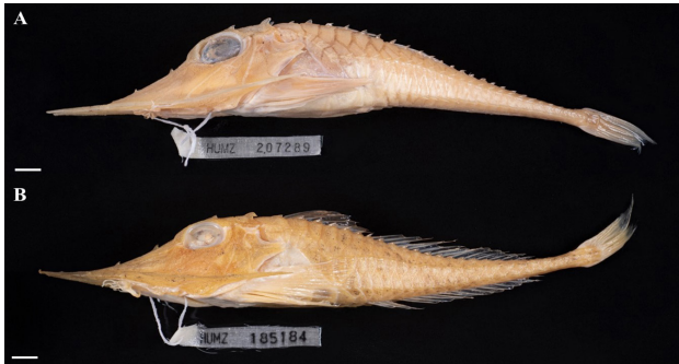
Fig. 3. Image of comparative specimens. A, Lateral view of Satyrichthys welchi from Australia (HUMZ 207289; 186.8 mm SL); B, S. laticeps from Taiwan (HUMZ 185184; 190.6 mm SL); SL, standard length.

리지느러미는 정미이며, 가운데부분이 약간 만입되어 있다. 머리는 전체적으로 단단한 골판으로 덮여 있으며, 두정부는 총 네 개의 골판으로 분획되어있고, 후단의 골판의 크기는 같다(Fig. 2B). 머리의 후단에서 시작하는 골판은 몸 전체적으로 열을 이루고 있으며 총 4열을 이룬다. 등쪽 골판의 개수는 27개, 측면 상단 골판 32개, 측면 하단 22개, 항문 뒤 22개의 골판으로 이루어져 있으며, 항문 전 골판의 개수는 2개로 다른 골판보다 크다. 등쪽, 측면 상단, 측면 하단의 뒤쪽을 향하는 3열의 날카로운 극이 줄지어 있다. 극은 몸에 연속되는 골판의 정중앙부에 위치하며, 가장 위쪽의 극과 아래쪽은 몸의 끝을 따라 연속되고, 가운데 극은 새개부 뒤쪽에서 일직선으로 이어지다가 등쪽 세번째 골판의 위치를 기점으로 급격하게 내려온 후 네번째 골판에서 일직선으로 꼬리 끝까지 이어진다. 미병부의 극은 양방향으로 존재한다(Fig. 2C).